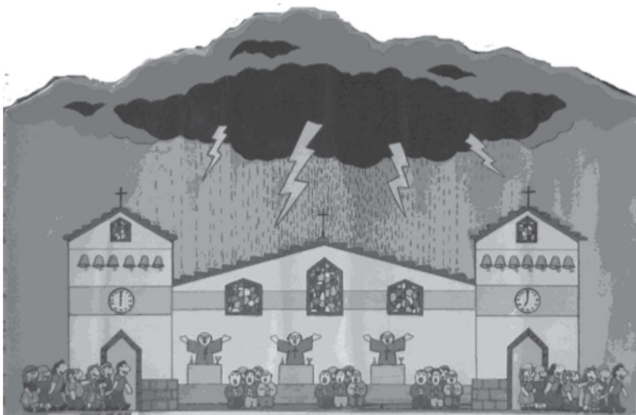
Figura 1: Audiopartitura Chuva na Matriz

solo versus tutti entre padre e assembléia, e a tempestade) e menos óbvios (como a inclinação do telhado, sugerindo a direcionalidade sonora e os vitrais, que remetem ao eco das catedrais), há uma pluralidade de possibilidades musicais a serem exploradas.